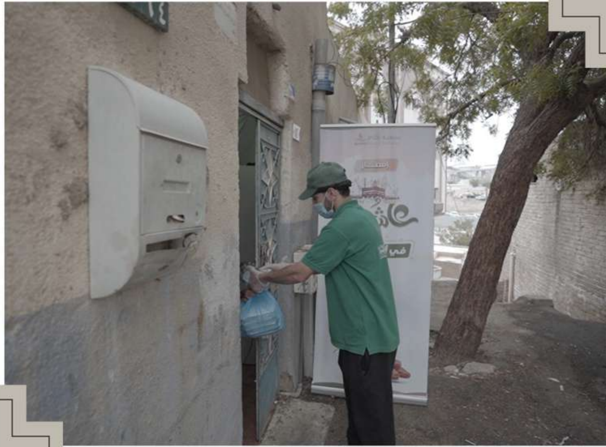
توزيع الوجبات الساخنة على الأسر