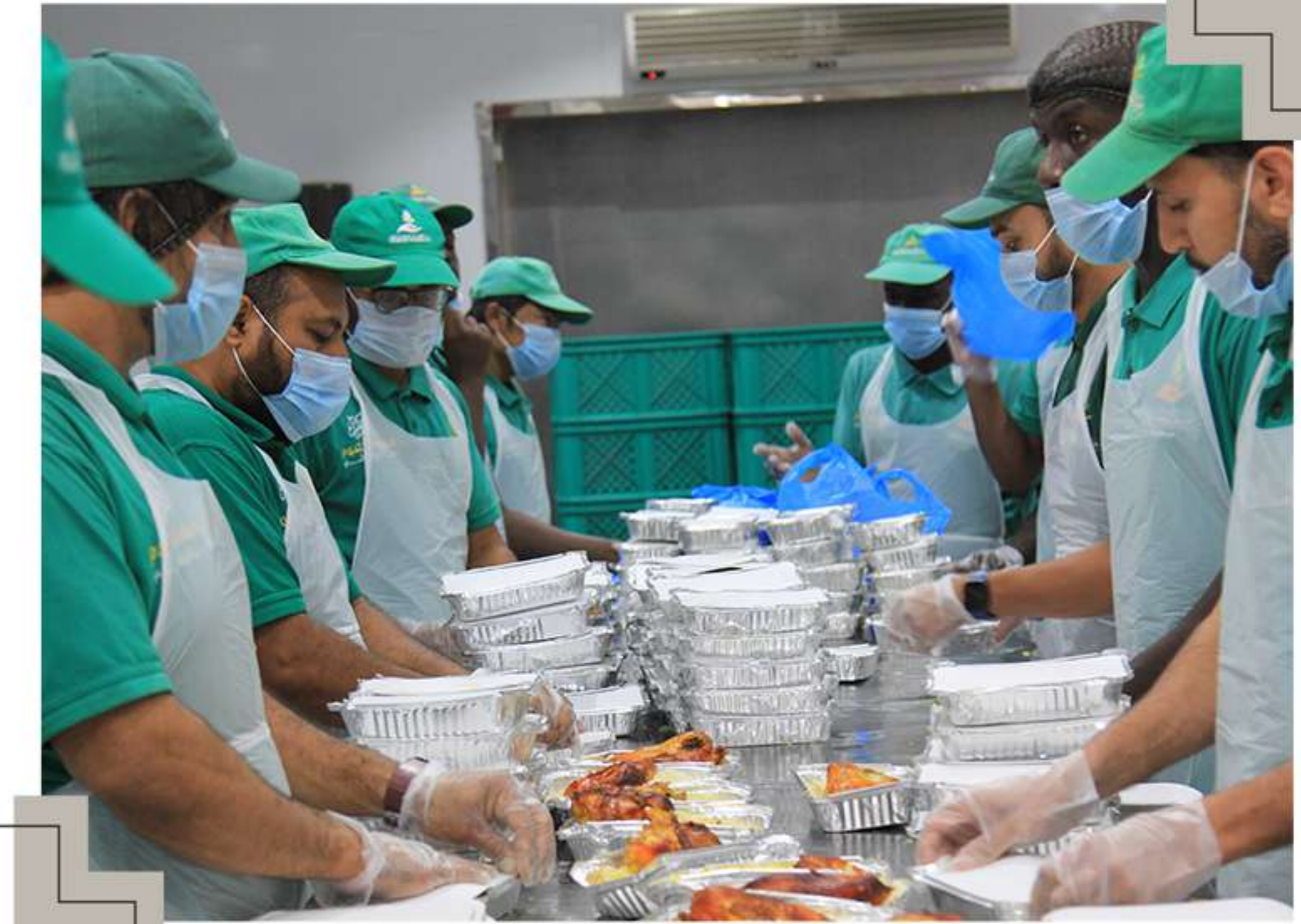
إعداد وتجهيز الوجبات الساخنة