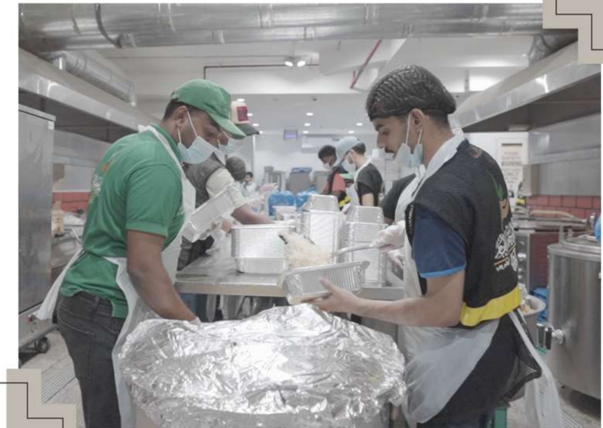
جمع فائض الطعام