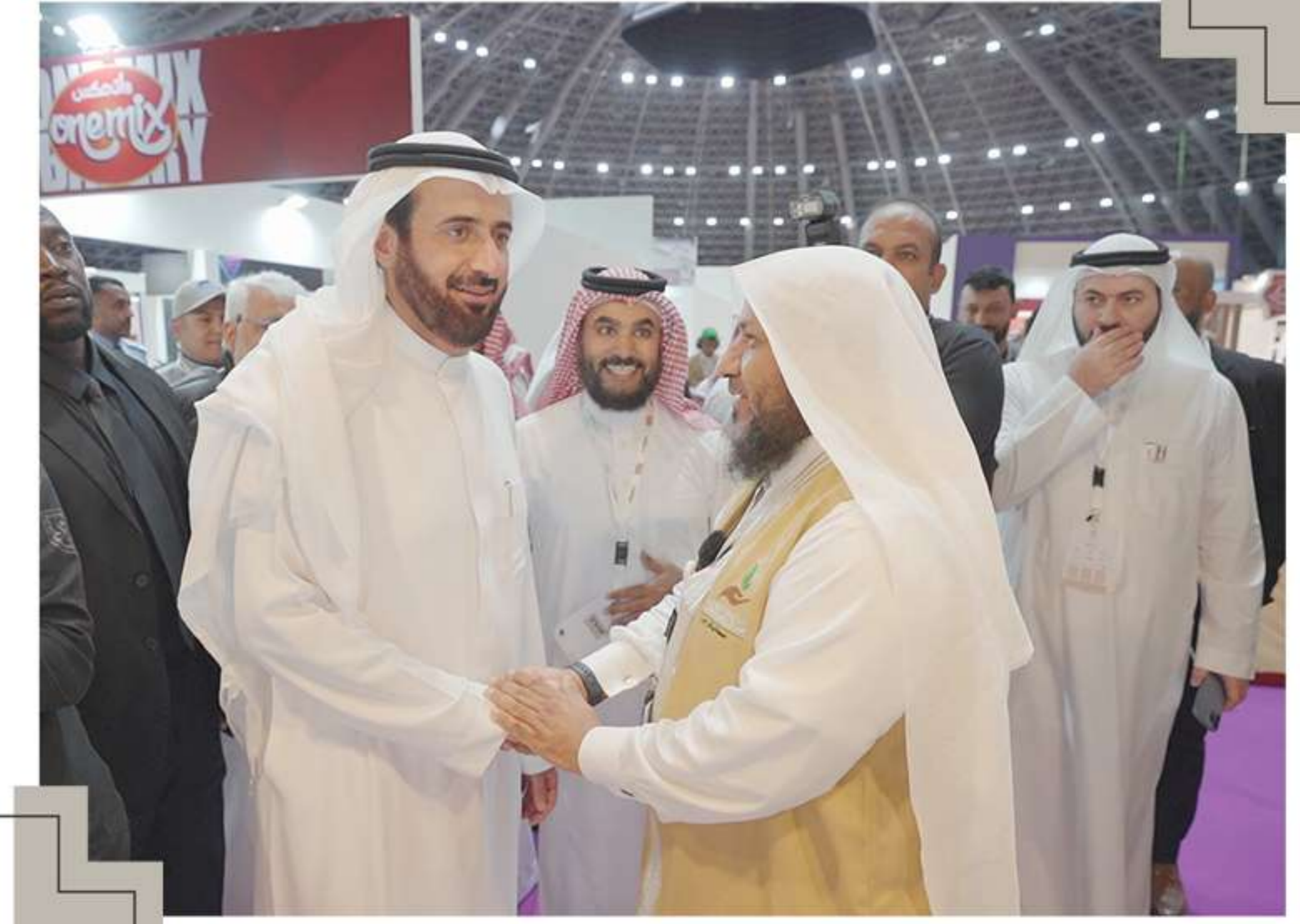
زيارة من معالي وزير الحج والعمرة الدكتور توفيق الربيعية لجناح الجمعية في معرض اكسبو الحج