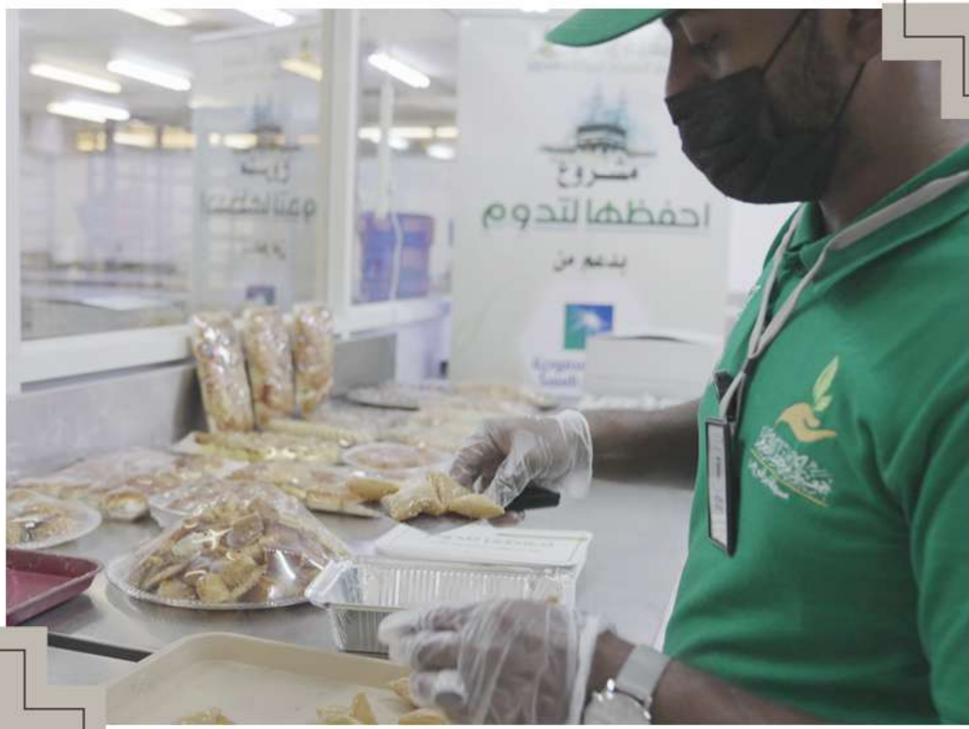
جمع فائض الحلويات