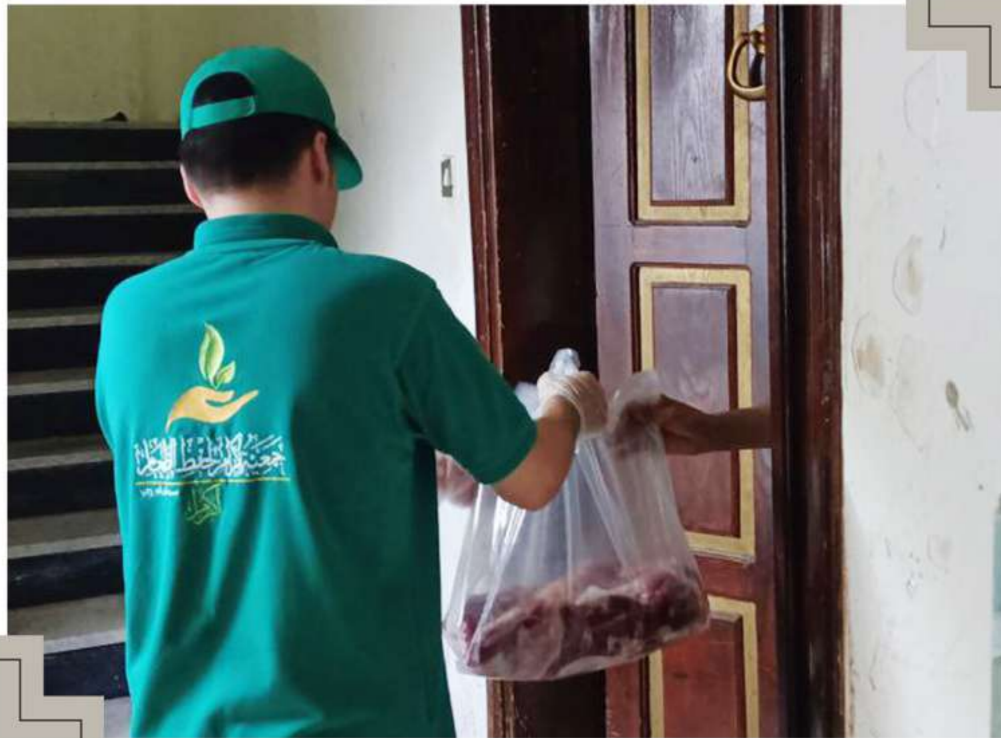
توزيع اللحوم الطازجة