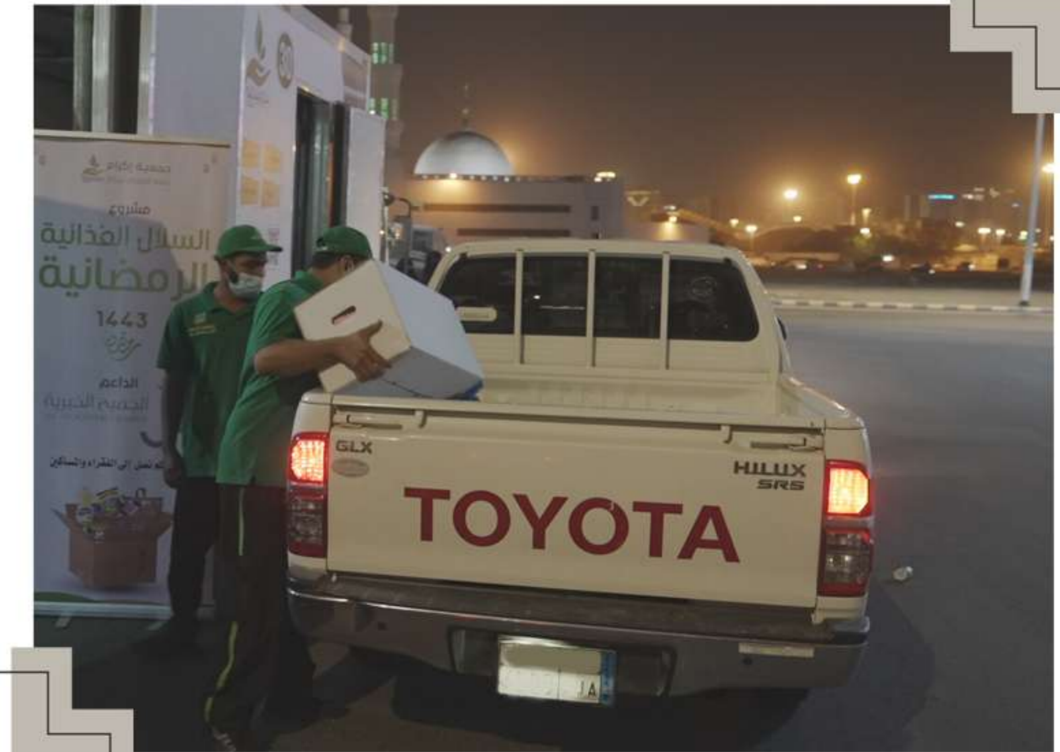
توزيع السلال الغذائية