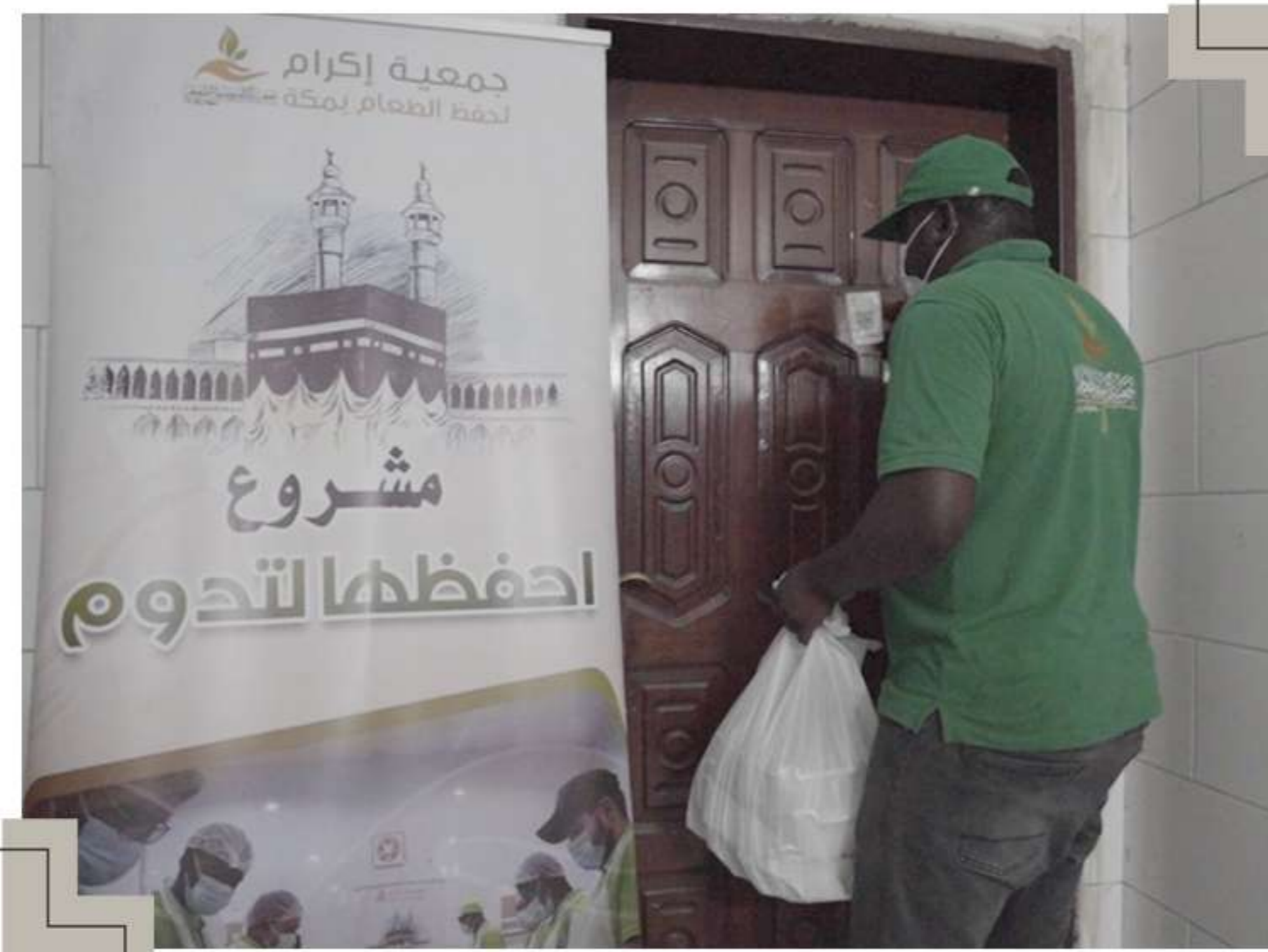
توزيع على الأربطة الخيرية