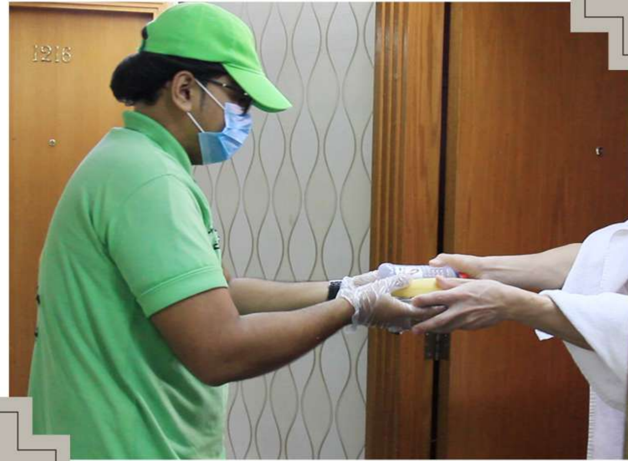
توزيع الوجبات الساخنة على المعتمرين