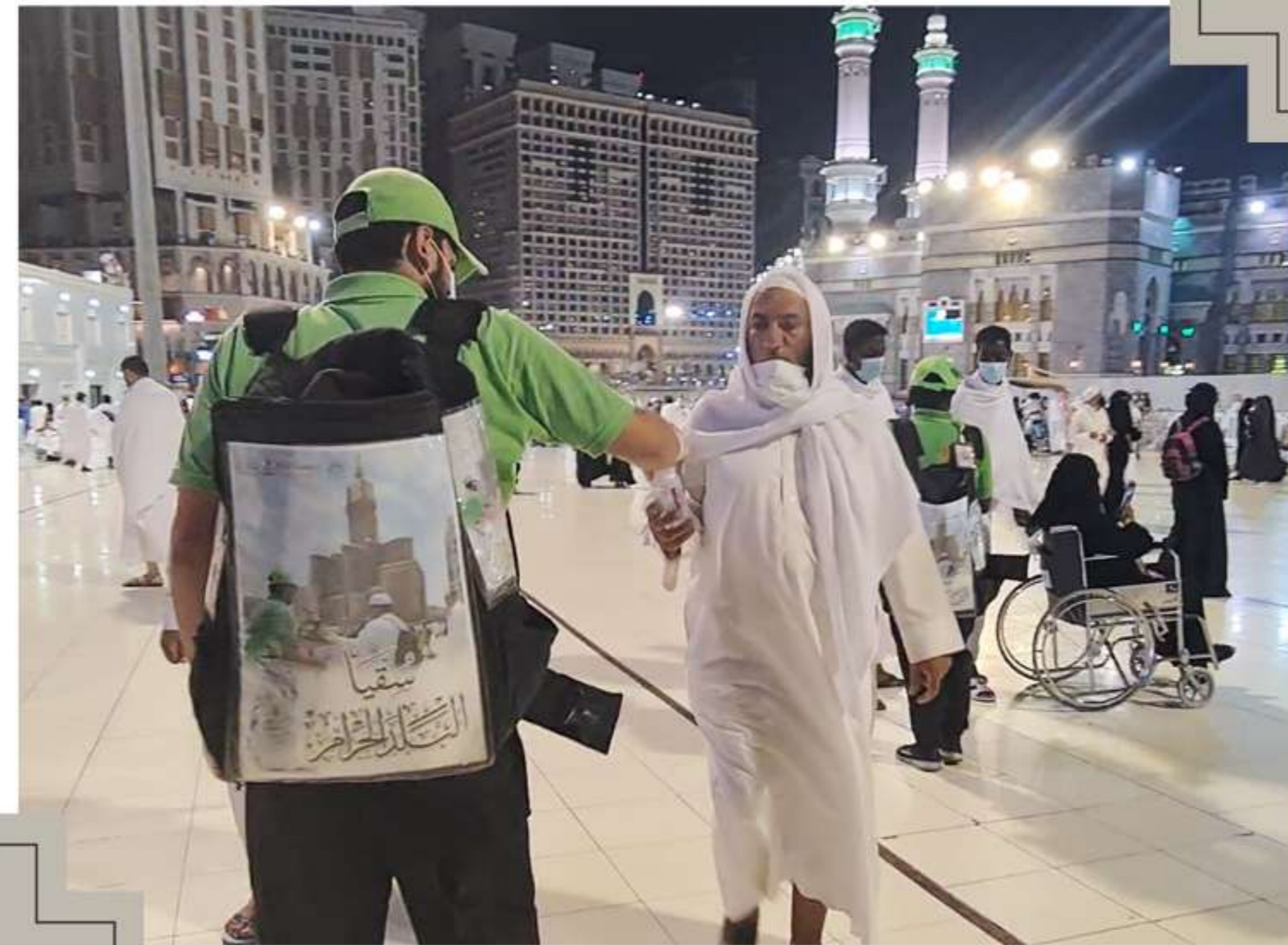
توزيع سقيا الماء في المسجد الحرام