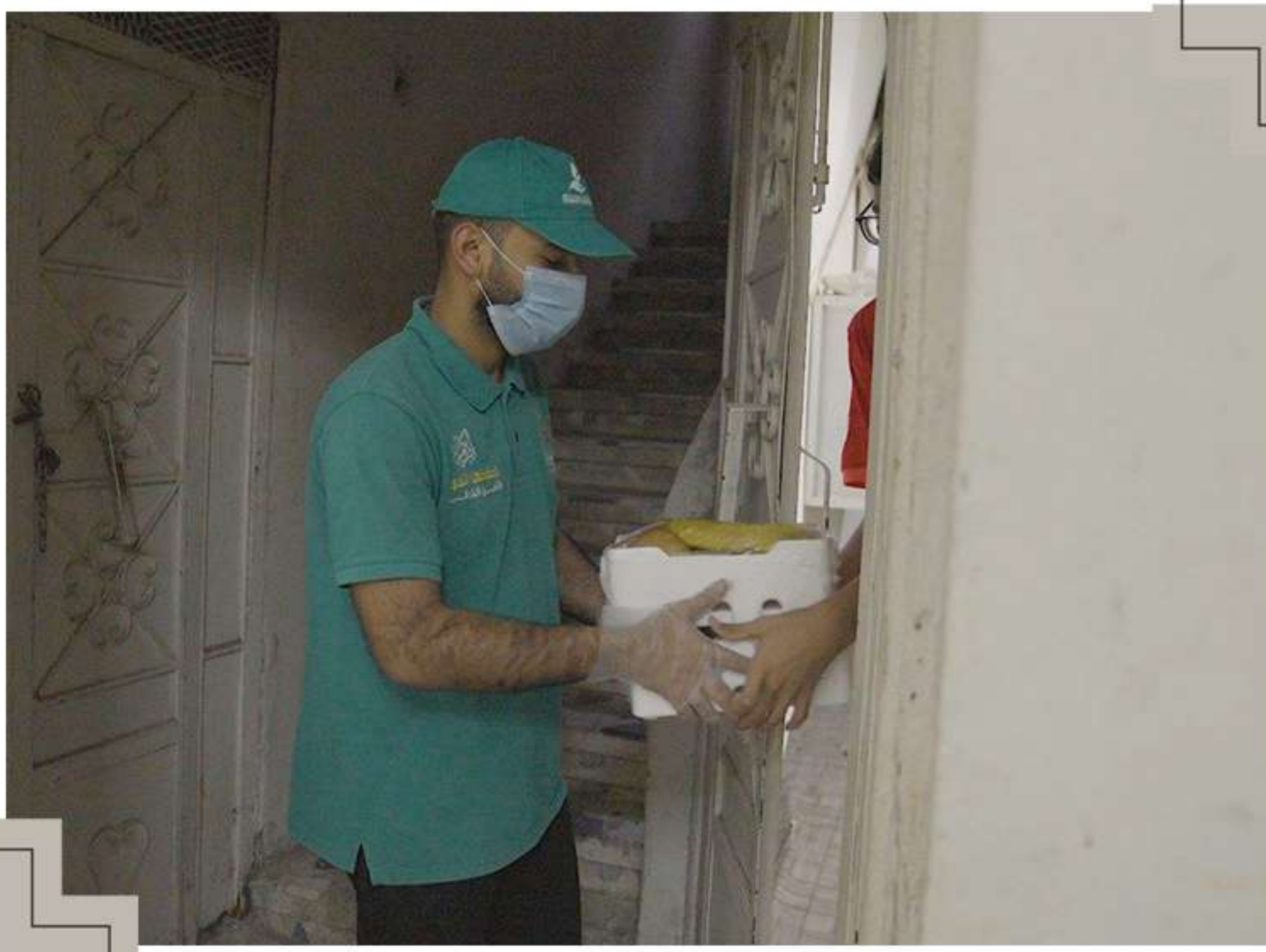
حفظ وتوزيع فائض الخضروات والفواكه