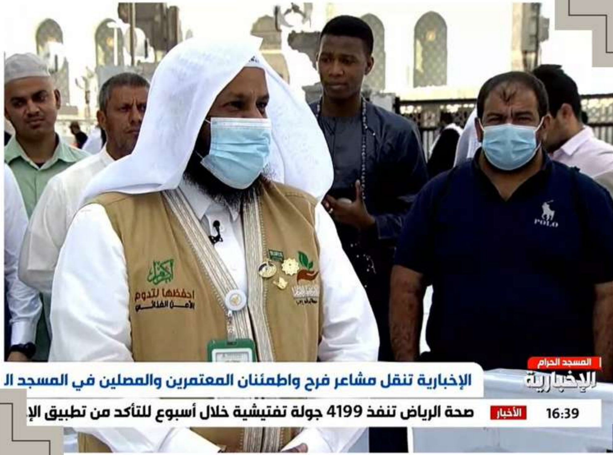
الإخبارية تنقل مشاعر فرح واطمئنان المعتمرين والمصلين في المسجد الإخباري 16:39 الأخبار صحة الرياض تنفذ 4199 جولة تفتيشية خلال أسبوع للتأكد من تطبيق الإ