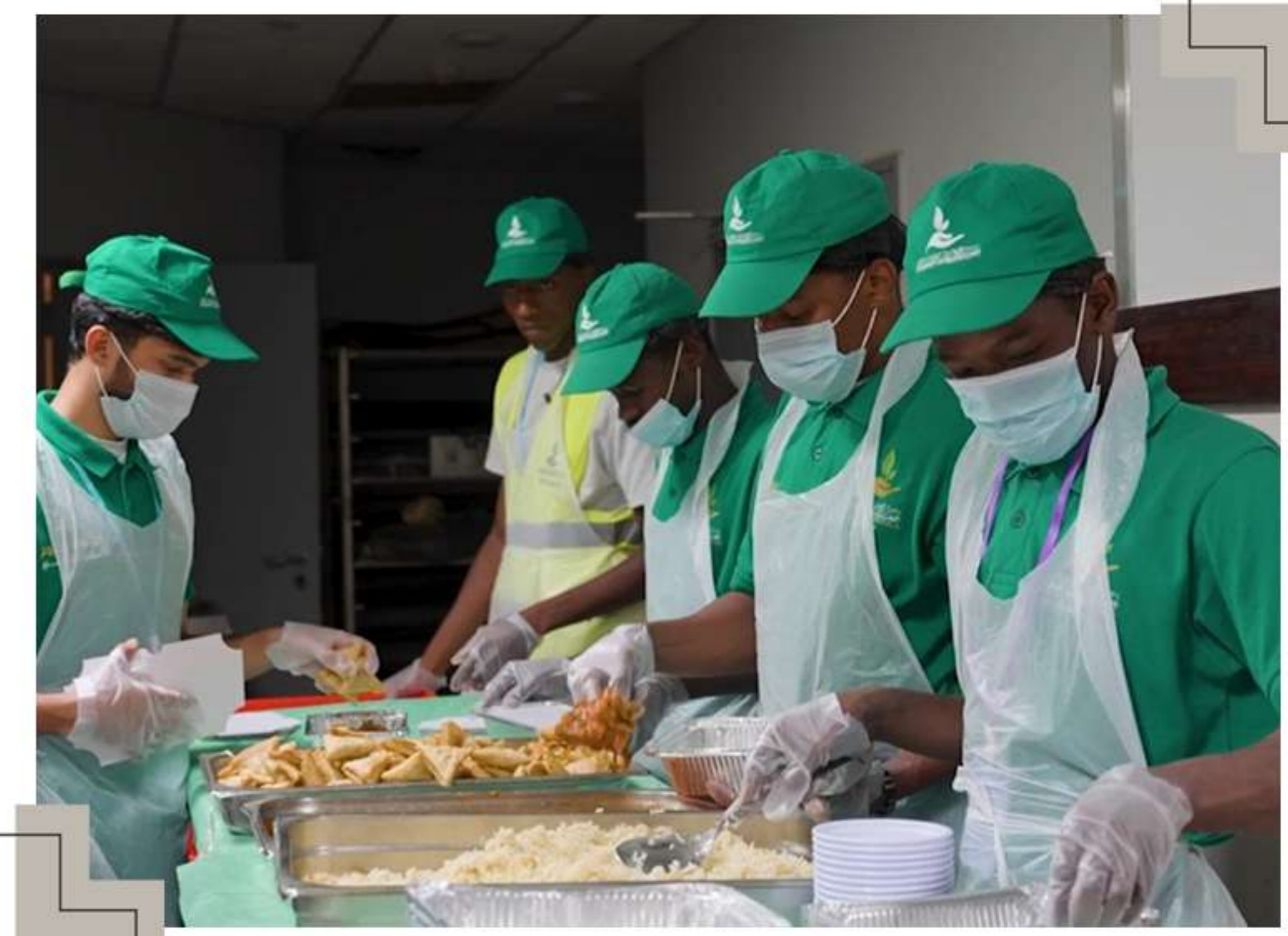
جمع فائض الطعام من الفنادق