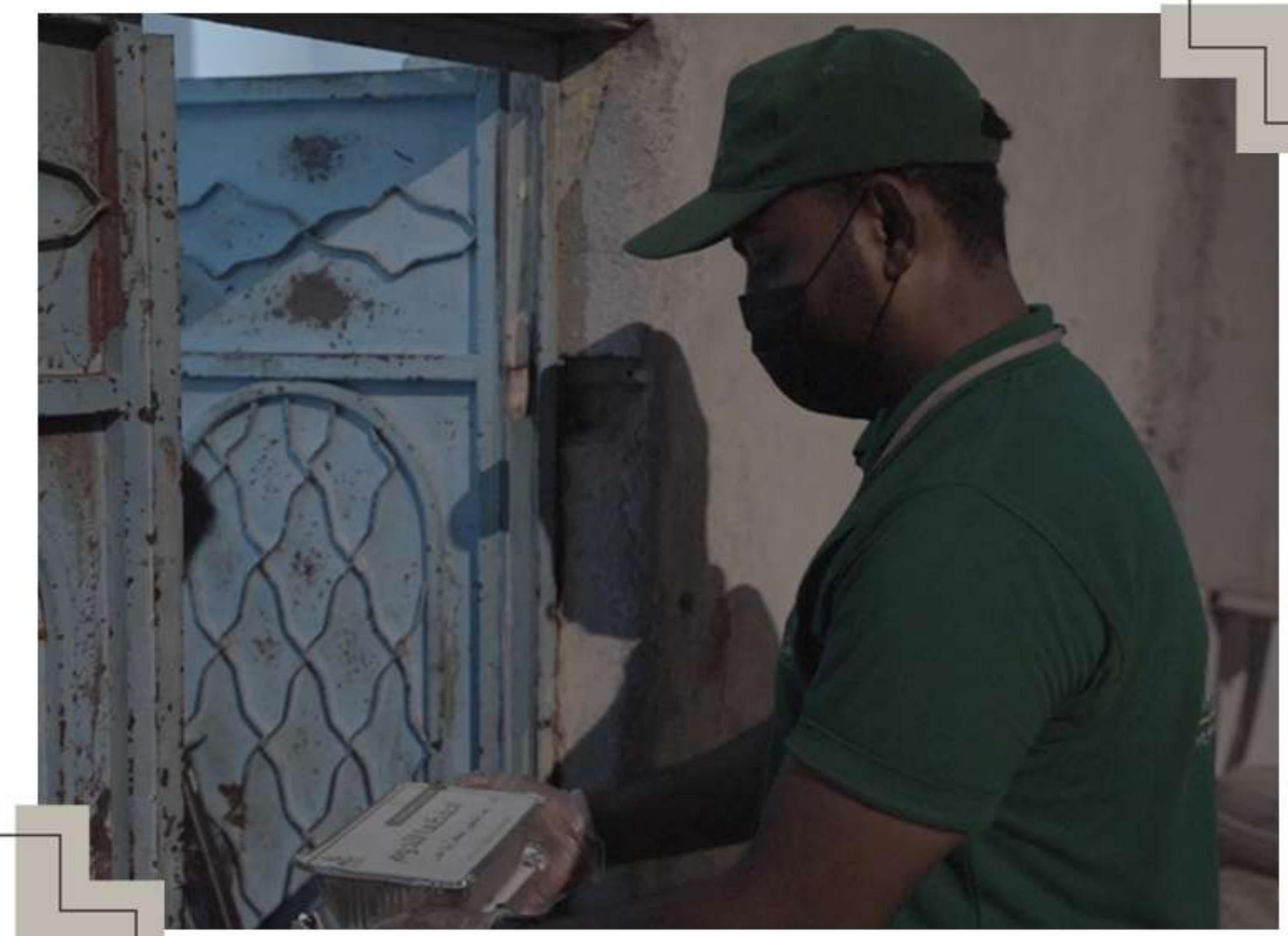
توزيع على الأسر المحتاجة