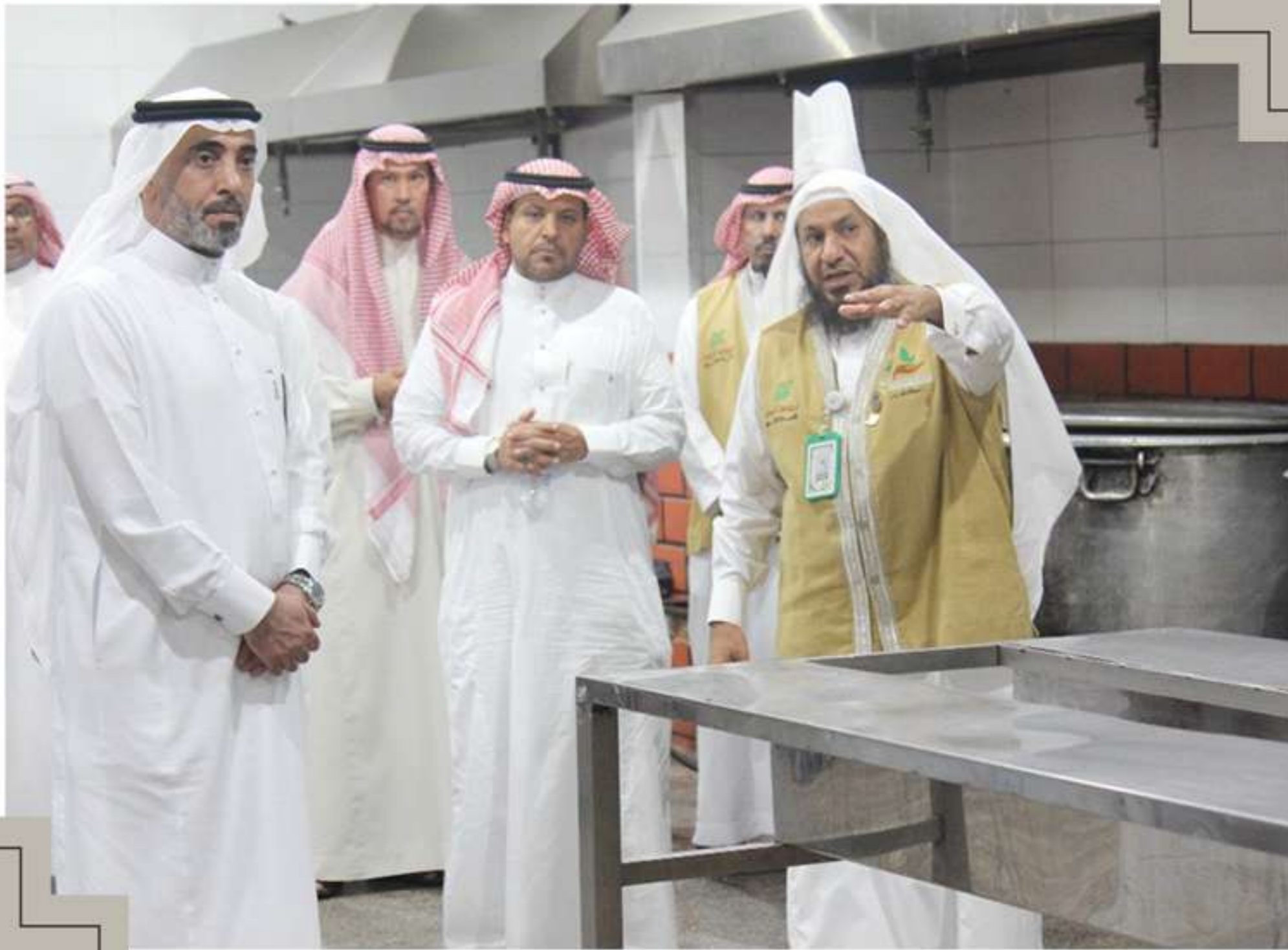
زيارة نائب أمين العاصمة المقدسة المهندس / إبراهيم الغامدي