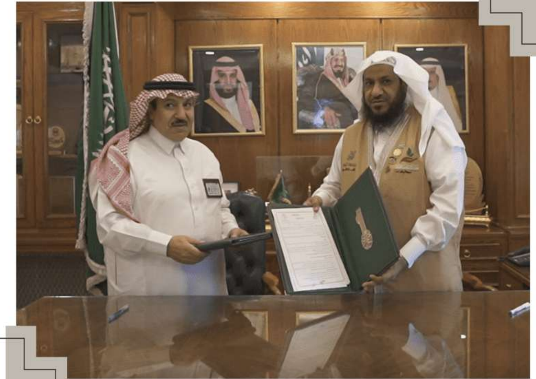
اتفاقية مع وزارة البيئة والمياه والزراعة