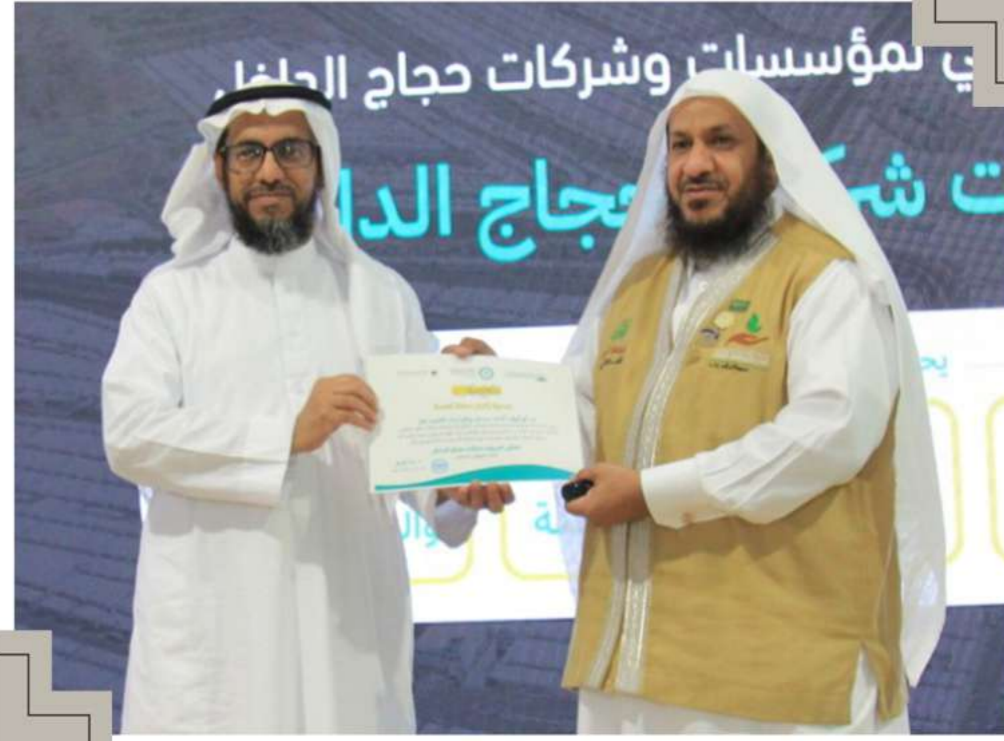
تكريم من المجلس التنسيقي لمنشآت خدمة حجاج الداخل