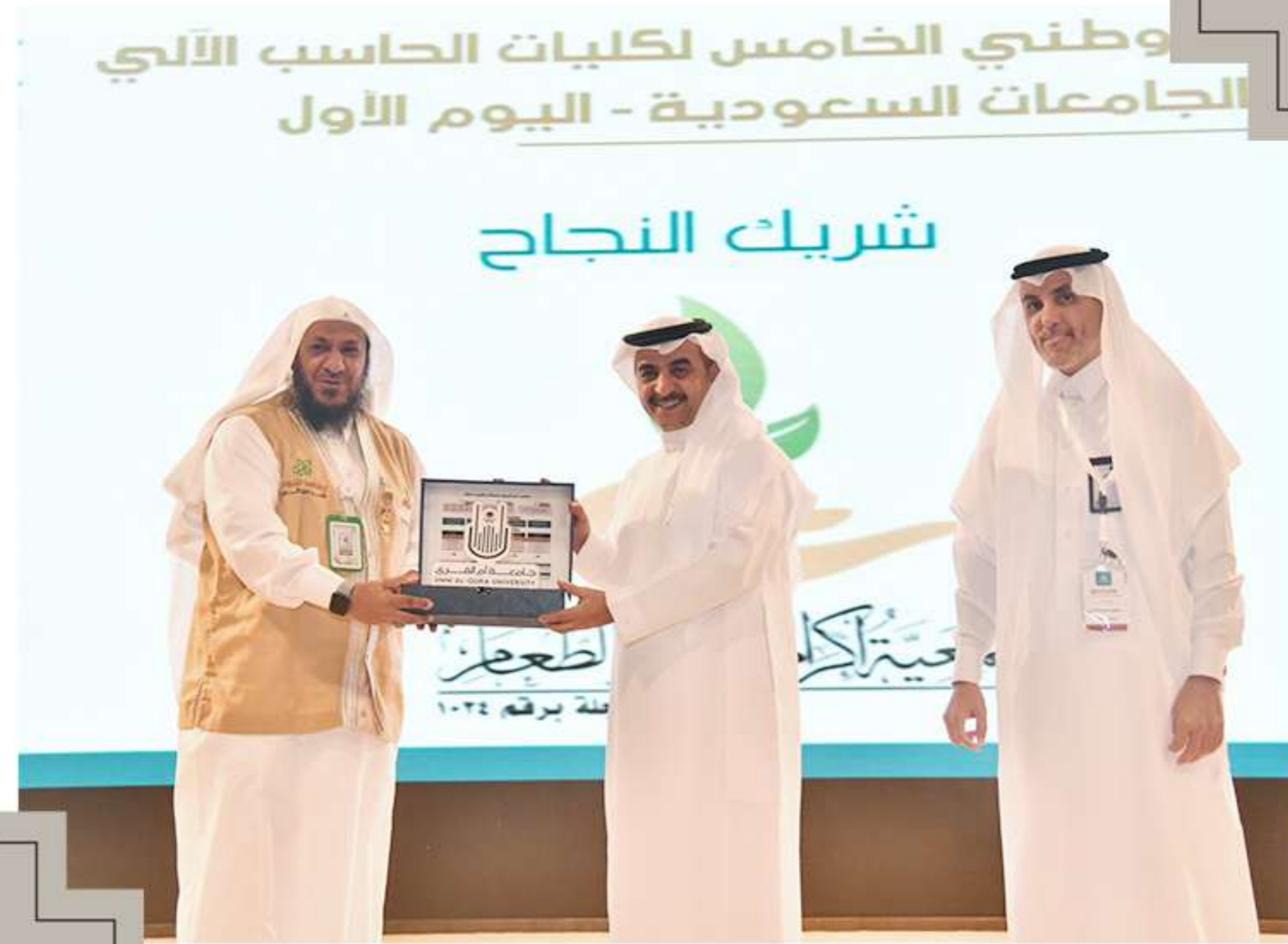
تكريم من سعادة رئيس جامعة أم القرى أ.د. معدي محمد آل مذهب