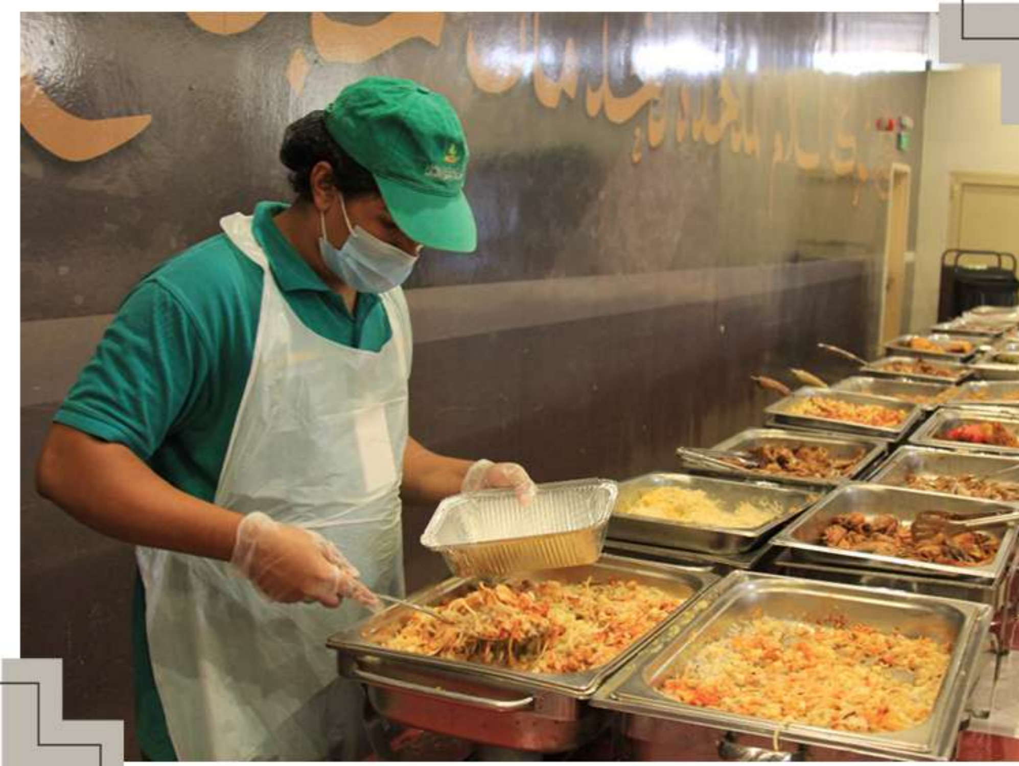
جمع فائض الطعام من حملات الحج