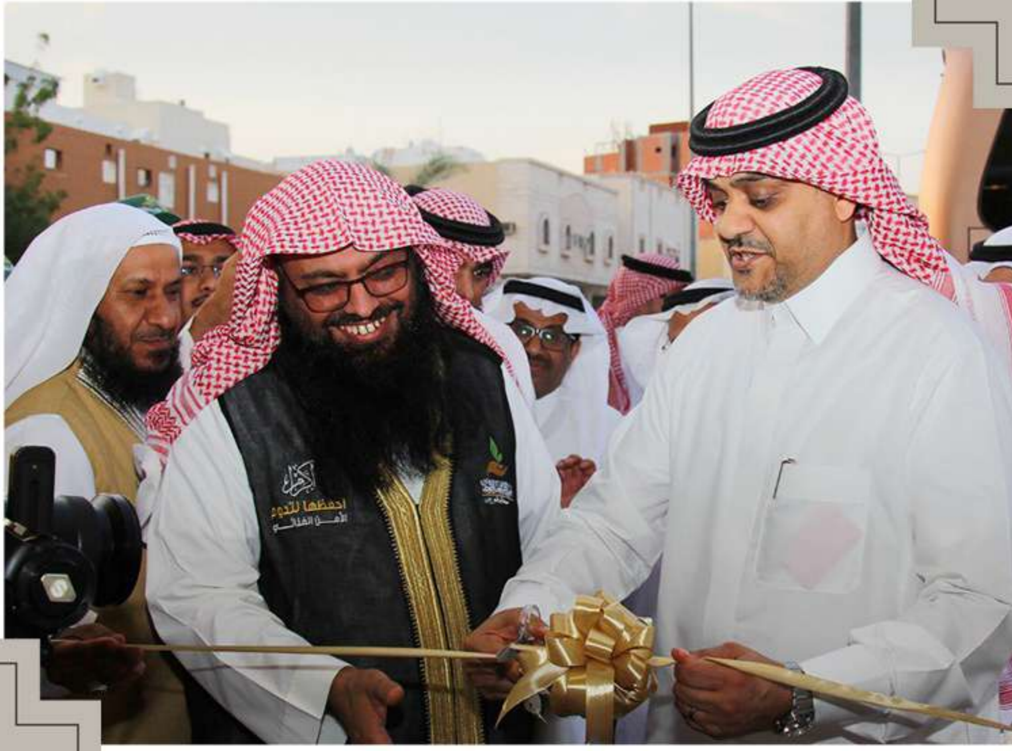
افتتاح الوقف الأول لحفظ النعمة برعاية من نائب معالي وزير الشؤون البلدية القروية الإسكان المهندس / عبدالله بن محمد البدير