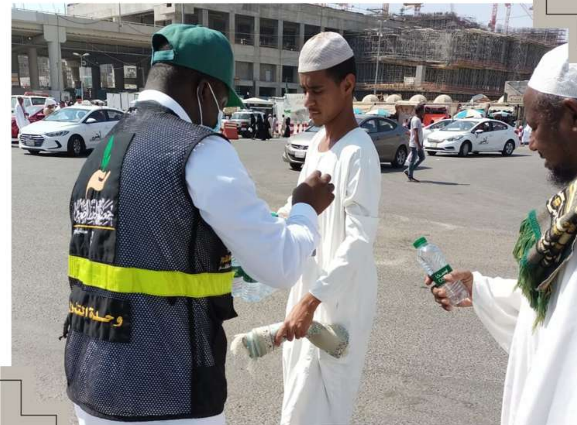
توزيع سقيا الماء على قاصدي بيت الله الحرام